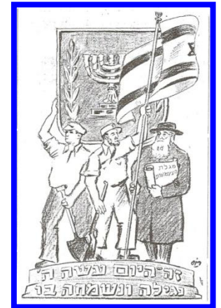
הצפה, ה' אייר תש"ט

אז התנופף ברמה מעל כל בית בישראל הדגל הלאומי, וגם ציבור בני התורה מכל הגוונים לא ראה לנכון להסתייג ממנו. נכון, שמאז התרחשו הרבה דברים שגרמו אכזבה ומפח נפש לציבור שומר תורה ומצוה. ודאי שלא כך ציפינו שתהא התפתחות המדינה. לא חשבנו שמוסדות השיפוט במדינה יקומו ויהיו כהמשך למוסדות השיפוט ויסודות השיפוט שהיו קיימים בימי המנדט. בתמימותנו דמינו, שמעתה יוכרז שמשפט מדינת ישראל הוא משפט התורה, שיסודותיו כל כך מוסריים והגיוניים וכל כך הרבה תבונה וחריפות של גאוני עולם הושקעו בו, כהמשך מסורת ישראל ממשה מסיני, יהוו מעתה המשפט המוכר והיחידי; אך לא כן היה, השפחה ירשה את גבירתה, ולא עוד אלא שהולכים ומצירים מדי פעם את השארית הנשארת בדמות חוקי האישות והמשפחה; לא דימינו שהחינוך, הנקרא כללי, יחנך ילדי ישראל ללא דעת תורת ישראל. ספר הספרים, אשר הוא המקור גם לכל התרבות האנושית