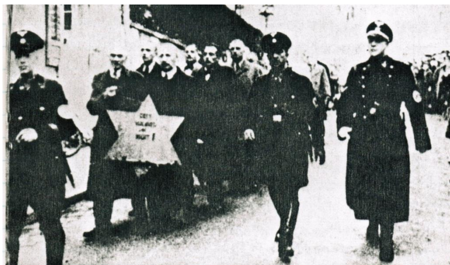
The Jews were led through the streets of Baden-Baden by the Nazis to the National Hotel. They had to carry a Star of David inscribed "God, do not abandon us."

מסכת סנהדרין צז. - תנו רבנן, כי ידיו ה' עמו... כי יראה כי אזלת יד ואפס עצור ועזוב - אין בן דוד בא עד שירבו המסורות... דבר אחר: עד שיתייאשו מן הגאולה. שנאמר ואפס עצור ועזוב - כביכול אין סומך ועוזר לישראל. רש"י - אין עוזר ואין סומך לישראל - שיהיו שפלים למאד , ואומר: אין עוזר וסומך - שיהיו מתייאשין מן הגאולה.