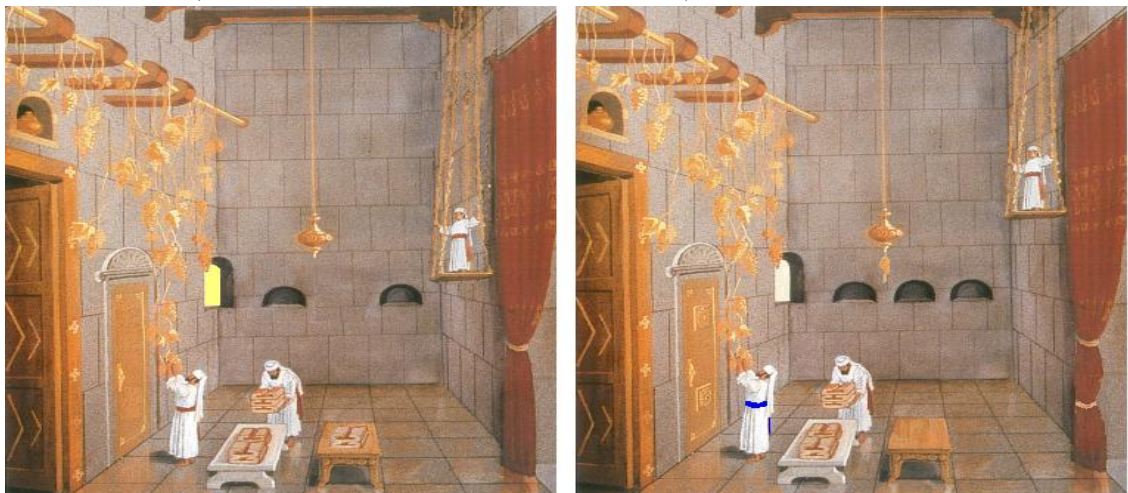
מוזגים כוס שלישית של יין לבן מהול בין אדום

בתמונות רואים את פתח ההיכל עם גפן של זהב בחזית. מצאנו את תשעת ההבדלים בין שתי התמונות.