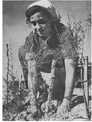
כך הולכים השותלים רון בלב ואת ביד...

חכמים מביאים בתלמוד (תענית כג.) סיפור על חוני המעגל.