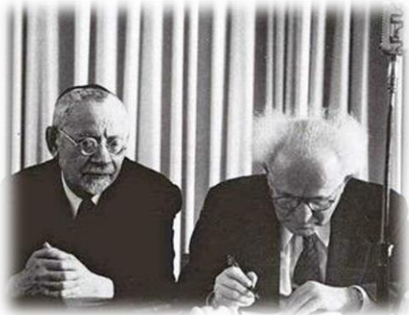
דוד בן גוריון