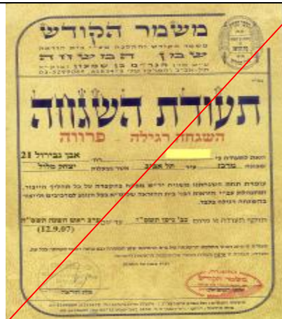
משמר הקודש - שמן המשחה