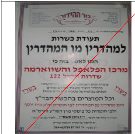
בד"ץ נזר ההידור