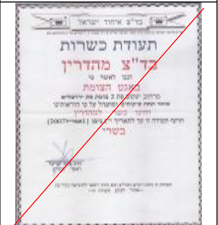
בד"ץ איחוד ישראל