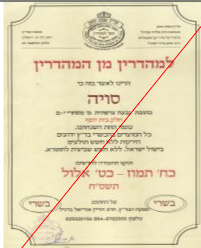
בד"ץ נחלת יצחק