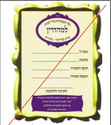
ועד הכשרות מור ולבונה