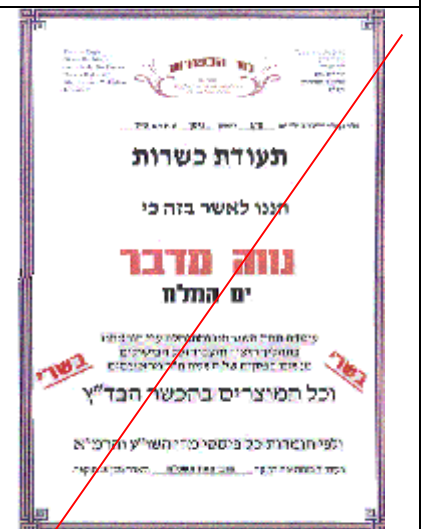
בד"ץ נזר הכשרות

בביקורות שנערכו במקומות המושגחים על ידם נמצאה רמת כשרות מתחת לכל ביקורת ושומר נפשו ירחק!