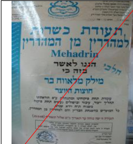
בד"ץ כתר הכשרות