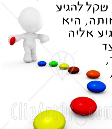
ר' שמלקא מניקלשבורג זצ"ל

נקודה קרובה להשגה, שקל להגיע אליה, שקל לשמור אותה, היא תשפר את מאזנך. נגיע אליה ונקבע לעצמנו את היעד הבא... אם נבוא כך, בתכנית מוגדרת, קרובת טווח ודאי נזכה להצלחה לכתיבה ולחתימה טובה.